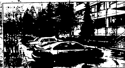
6 жовтня. Зупинка зникла, чи надовго?

Того ж дня інтернет-видання "Курс" повідомило, що одним із засновників підприємства є депутат міської ради Володимир Крижень. Нагадаємо, що саме він ініціював івано-франківський міський штаб Петра Порошенка. Новина про те, що інвестор уже визначений, м'яко кажучи, здивувала присутніх на громадських слуханнях. Попри те, що представників громади на слуханнях не було, представники влади опонували журналі-